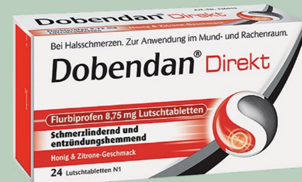
Dobendan Direkt Flurbiprofen 8,75 mg* 24 Lutschtabletten

Wirkstoff: Efeublätter-Trockenextrakt. Anwendungsgebiete: Zur Besserung der Beschwerden bei chronisch-entzündlichen Bronchialerkrankungen; akute Entzündungen der Atemwege mit der Begleitscheinung Husten.