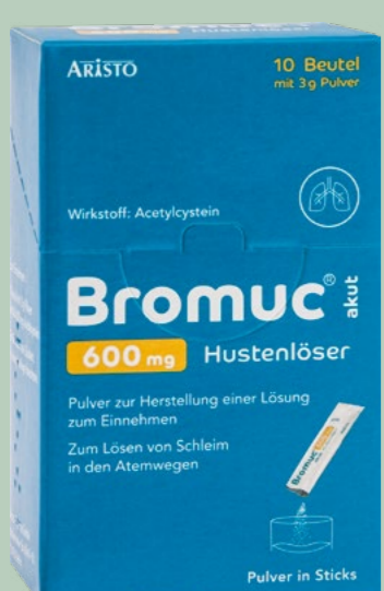
Bromuc akut 600 mg Hustenlöser* 10 Beutel

Wirkstoff: Xylometazolinhydrochlorid. Anwendungsgebiete: Zur Anwendung bei Erwachsenen, Jugendlichen und Kindern über 6 Jahren. Zur Abschwellung der Nasenschleimhaut bei Schnupfen, anfallsweise auftretendem Fließschnupfen (Rhinitis vasomotorica) und allergischem Schnupfen (Rhinitis allergica). Zur Erleichterung des Sekretabflusses bei Entzündung der Nasennebenhöhlen sowie bei Katarrh des Tubenmittelohrs in Verbindung mit Schnupfen.