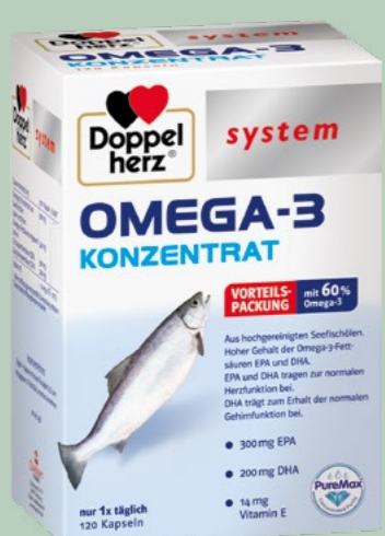
Doppelherz system OMEGA-3 KONZENTRAT 120 Kapseln

Wirkstoff: Omeprazol. Anwendungsgebiete: Zur kurzzeitigen Behandlung von Refluxbeschwerden (z. B. Sodbrennen, Säurerückfluss) bei Erwachsenen.