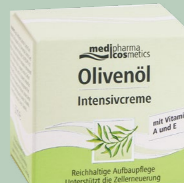
Olivenöl Intensivcreme 50 ml