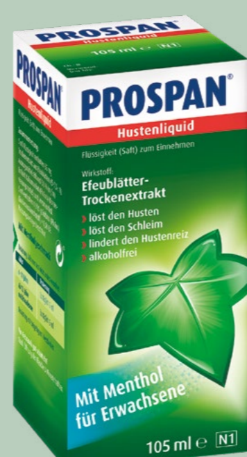
PROSPAN Hustenliquid* 105 ml