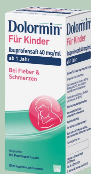
Dolormin Für Kinder Ibuprofensaft 40 mg/ml* 100 ml

Anwendungsgebiete: Gemäß der anthroposophischen Menschen- und Naturerkenntnis. Dazu gehören: Anregung des Wärmeorganismus und Integration von Stoffwechselfprozessen bei schmerzhaften entzündlichen Erkrankungen, die vom Nerven-Sinnes-System ausgehen, z. B. Nervenschmerzen (Neuralgien), Nervenentzündungen (Neuritiden), Gürtelrose (Herpes zoster), rheumatische Gelenkerkrankungen.