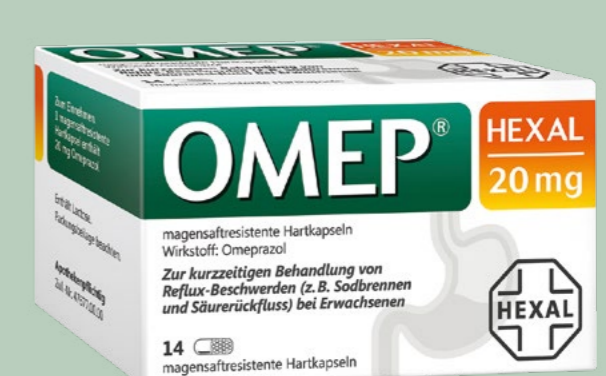
OMEP HEXAL 20 mg* 14 magensaftresistente Hartkapseln

Wirkstoff: Ibuprofen. Anwendungsgebiete: Bei leichten bis mäßig starken Schmerzen – wie Kopfschmerzen und Zahnschmerzen; Fieber. Für Kinder ab 10 kg (1 Jahr und älter), Jugendliche und Erwachsene. Bei Schmerzen oder Fieber ohne ärztlichen Rat nicht länger anwenden als in der Packungsbeilage angegeben!