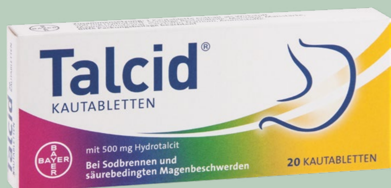
Talcid KAUTABLETTEN* 20 Kautabletten

Wirkstoff: Flurbiprofen. Anwendungsgebiete: Zur kurzzeitigen symptomatischen Behandlung bei schmerzhaften Entzündungen der Rachenschleimhaut bei Erwachsenen und Kindern ab 12 Jahren.