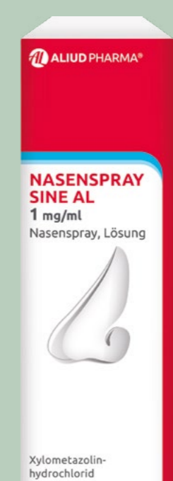
NASENSPRAY SINE AL 1 mg/ml* 10 ml

Wirkstoff: Flurbiprofen. Anwendungsgebiete: Zur kurzzeitigen symptomatischen Behandlung von akuten Halsschmerzen bei Erwachsenen.