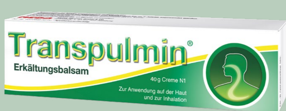
Transpulmin Erkältungsbalsam* 40 g

Wirkstoff: Hydrotalcit. Anwendungsgebiete: Zur symptomatischen Behandlung von Erkrankungen, bei denen die Magensäure gebunden werden soll: Sodbrennen und säurebedingte Magenbeschwerden.