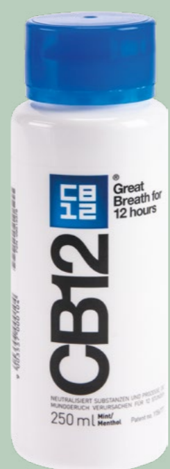
CB12 Mundspülung 250 ml