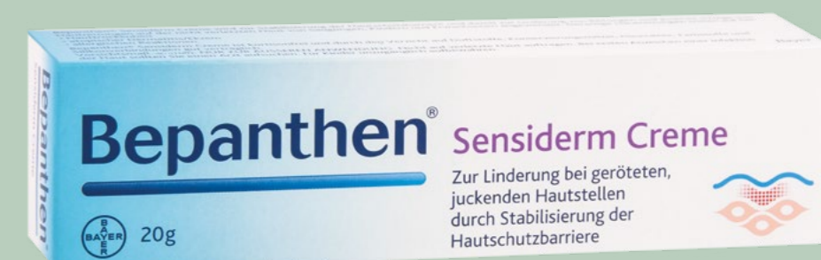
Bepanthen Sensiderm Creme 20 g