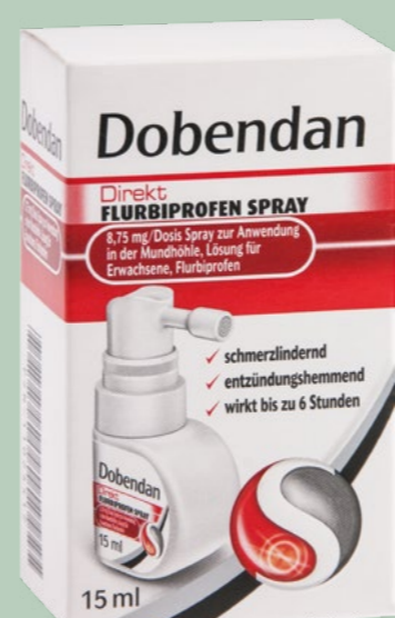
Dobendan Direkt FLURBIPROFEN SPRAY 8,75 mg* 15 ml

Anwendungsgebiete: Zur Anwendung auf der Haut und zur Inhalation. Zur äußeren Anwendung zur Verbesserung des Befindens bei Erkältungskrankheiten der Luftwege (wie unkomplizierter Schnupfen, Heiserkeit und unkomplizierter Bronchialkatarrh).